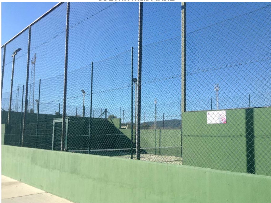
PISTAS PADEL 04