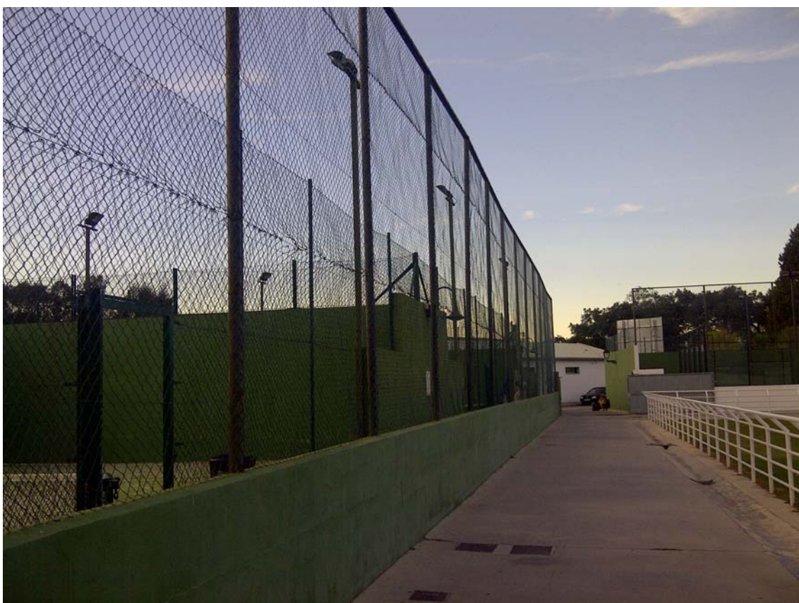
PISTAS PADEL 03