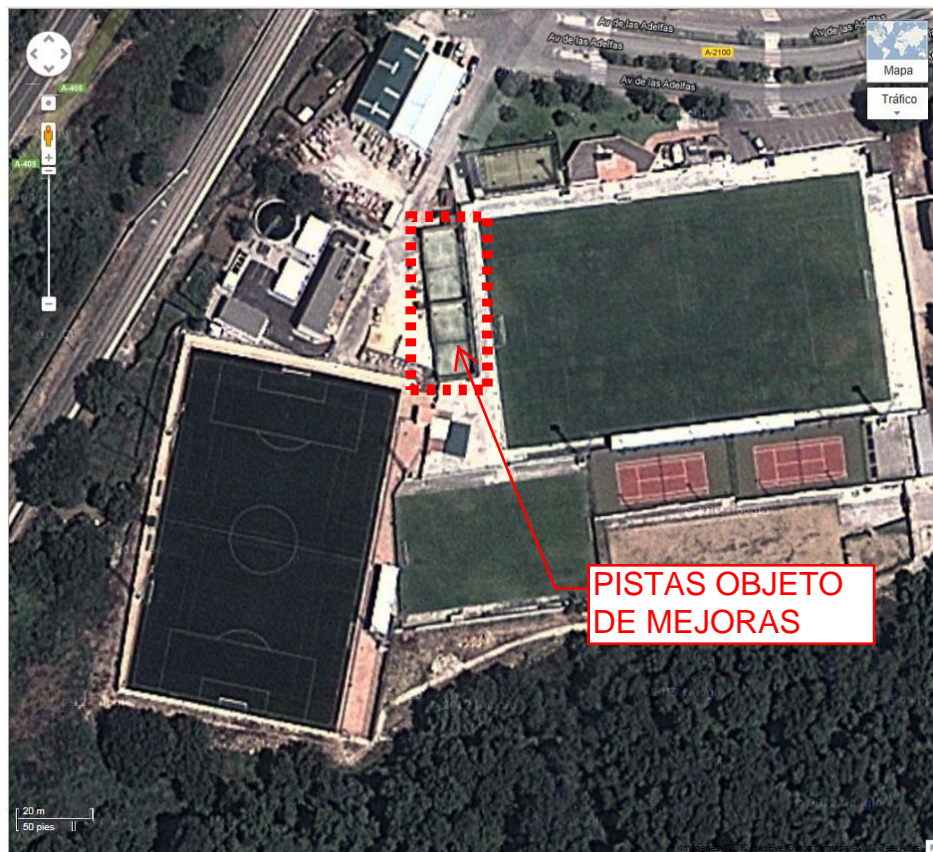
COMPLEJO MANUEL LEON