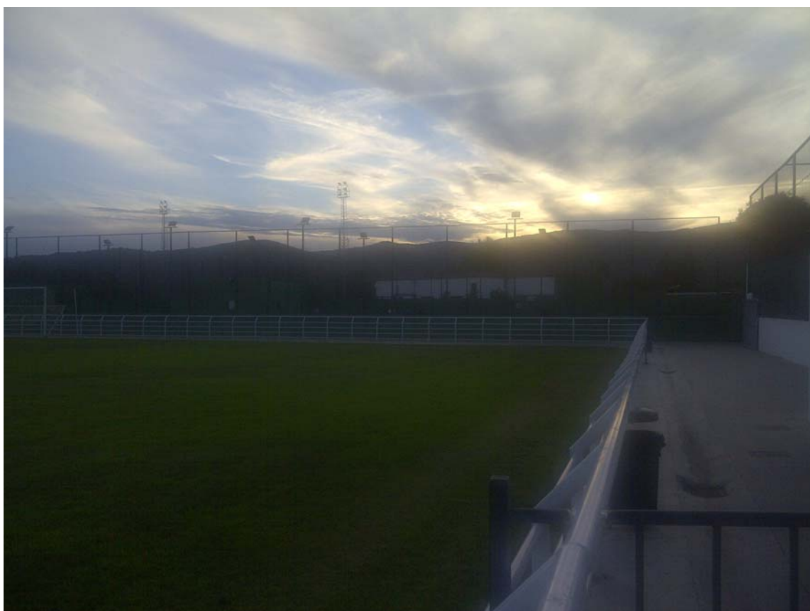
PISTAS PADEL 01