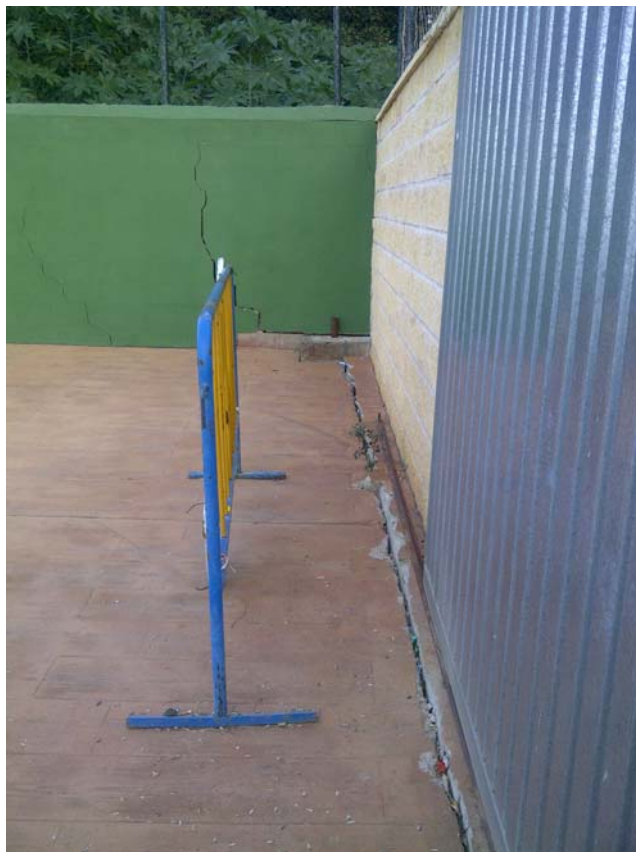
CAMPO DE FUTBOL 04