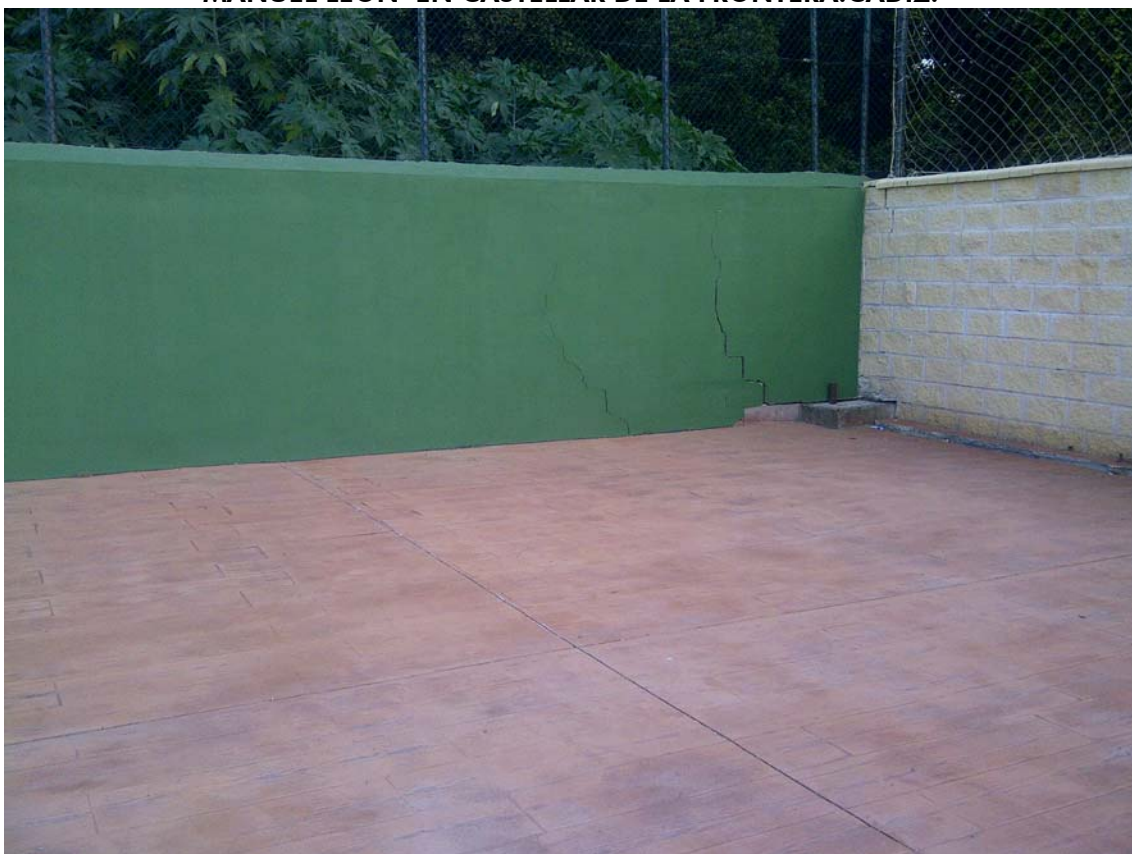
CAMPO DE FUTBOL 02