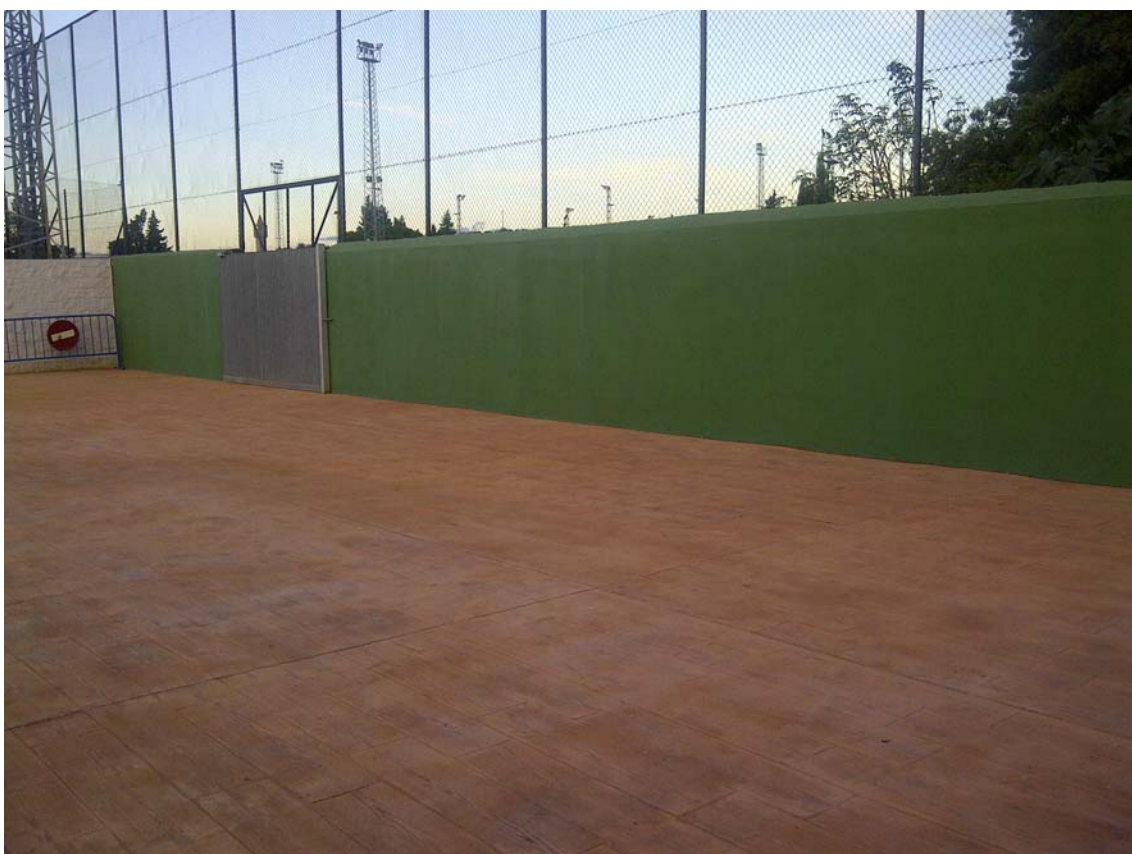
CAMPO DE FUTBOL 03