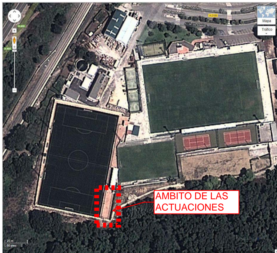
COMPLEJO MANUEL LEON