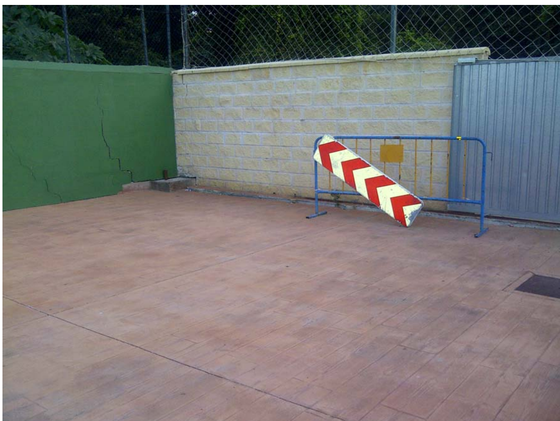
CAMPO DE FUTBOL 01